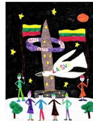
Agota Šiuliokaitė, 4 b kl.